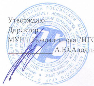
График остановок котельных и тепловых пунктов МУП г. Новоалтайска «НТС» для проведения плановых ремонтных работ в 2021 году.